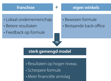
Figuur 3